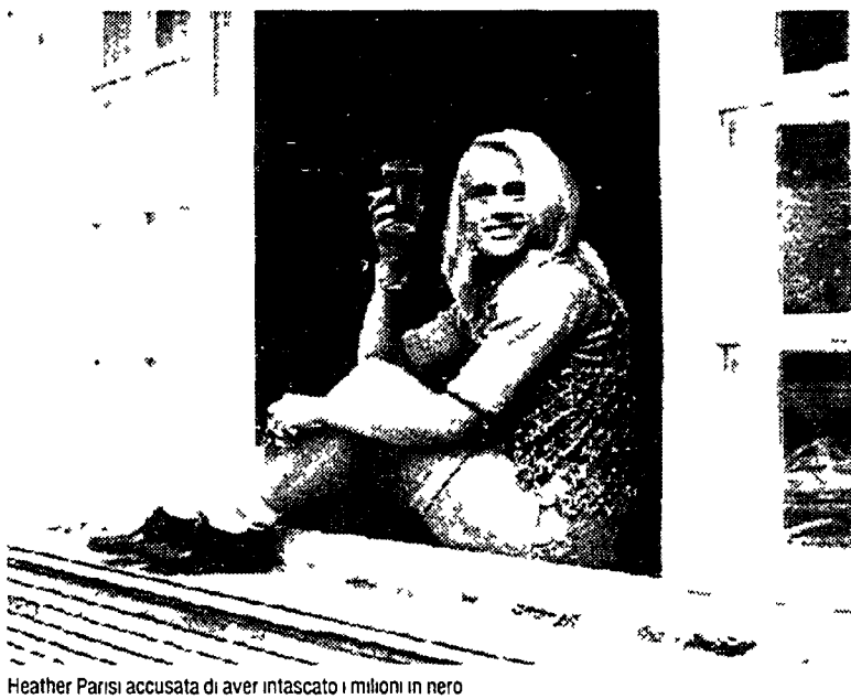
Heather Parisi accusata di aver intascato i milioni in nero