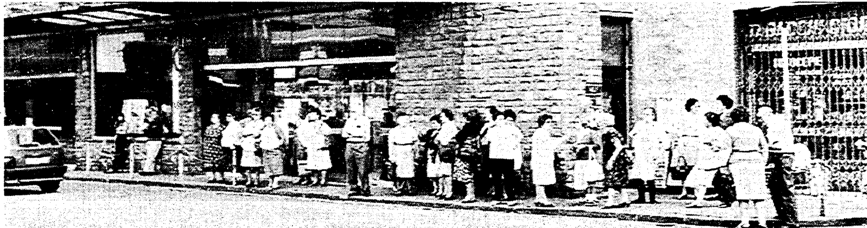
All'alba, in via Massarenti, a Bologna, aspettando il bus. Qui sotto il momento della partenza. Nelle foto al centro: un particolare dei depliant con i regali e uno dei tanti momenti di attesa

Ma... ecco la «presentazione pubblicitaria». Olio, robot coperte per spendere milioni E si torna con le «cambiali»