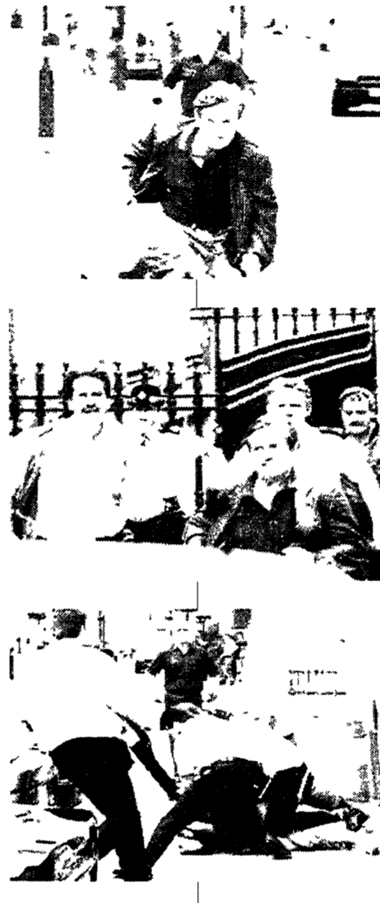
Nella sequenza l'arresto di un uomo che ieri ha saltato le grate all'ingresso di Downing Street cercando di raggiungere la residenza del primo ministro

ROMA. Il rilancio del modello federalista che ebbe per padre Altiero Spini... Oggi le opposizioni sono forse meno drammatiche ma non di meno sostanziali. Arte, il progetto delineato a Maastricht anche se non disprezzabile per tanti versi punta a un'Europa senza anima.