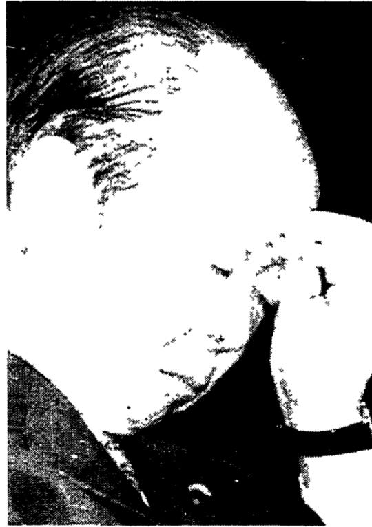
Il premier dimissionario Miyazawa

formare un governo anti Ldp assieme ai socialisti e alle altre forze di opposizione... Si dimette il premier Miyazawa e Kanemaru finisce in tribunale.