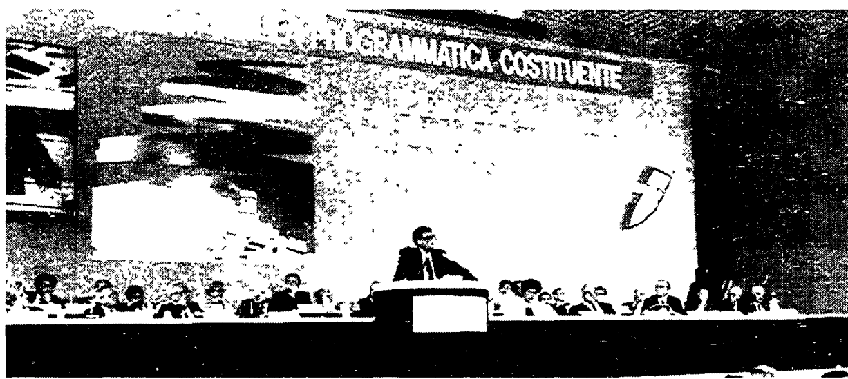
Mino Martinazzoli mentre espone la sua relazione all'assemblea costituente

I «centristi» di Casini e Mastella moderano i toni De Mita: «L'alternativa con il Pds si gioca sui programmi»