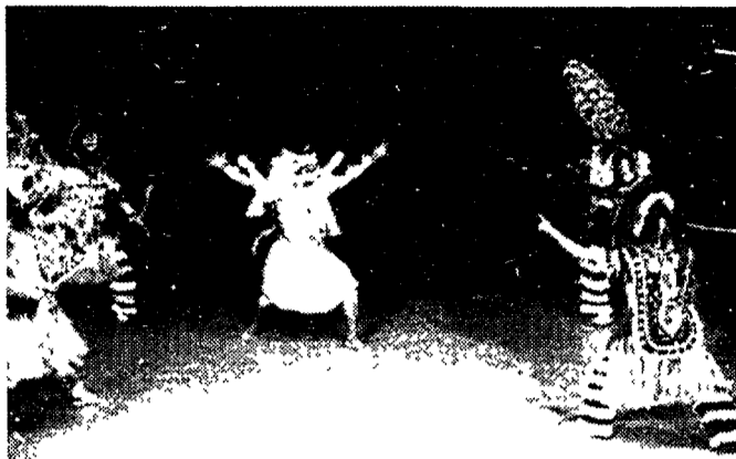
I danzatori «Chau» con indosso le loro splendide maschere