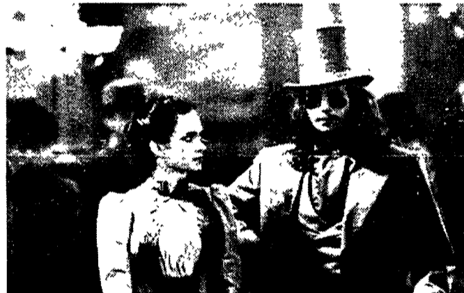
Un'immagine del film «Dracula» di Francis Ford Coppola