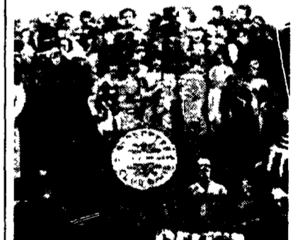
La storica copertina di Sgt. Pepper's dei Beatles