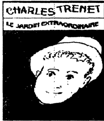
Charles Trenet dal «falso»

Le vent dans les bois fait hou hou hou La biche aux abois fait mé mé mé La vaisselle cassée fait cric crin crac