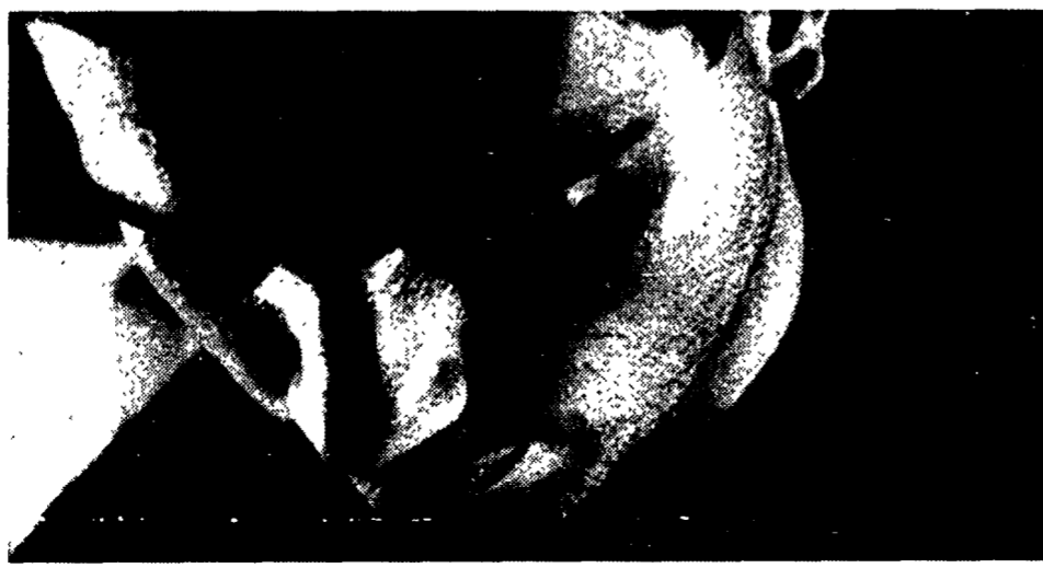
Luigi Tenco in una foto dei primi anni 60

Luigi Tenco aveva un'aria dai bei tenebrosi, accentuata da un qualcosa di insondabile che si portava dentro. Come un tarlo esistenziale che affiorava in tutte le sue canzoni, un che di lancia e di disperato, e al tempo stesso di beffardo e irridente. Una natura autunnale, capace però di una graffiante irriverenza e di un pungente anticonformismo. «Io sì che l'avrei insegnato qualcosa dell'amore che per lui è peccato». A metà degli anni Sessanta questo «innocuo» sembrava dirompente, insolente, distruttivo della prudenza codina e della morale da sacrestia che sempre imperava nell'Italia che faceva il suo timido ingresso nel cosiddetto «neo-capitalismo». Così almeno appariva al suo pubblico di allora, quel pugno di appassionati che anche nella scoperta