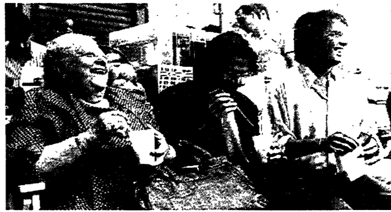
La Sora Lella in una spensierata immagine di qualche tempo fa

«Lei faceva l'ostessa e io facevo l'oste, lei teneva tra le mani un grosso libro che chiamavamo "Er Panonto" e leggeva, recitando, le massime della saggezza romana: cosa si mangia per le feste, quali sono i santi da invocare...», leggeva, era uno stratagemma per evitare che si stancasse troppo. Poi le chiede: quale canzone l'ha fatta innamorare? e cominciava piano piano, con la voce di una donna di settantotto anni a cantare «Nina si vvoi dormite». Sotto il cielo estivo il pubblico ascoltava quelle frasi melodiche fatte di dolcezza, di tenera passione, di trepidazione... e v'addolcisce er sonno cantando addocio adocio... forse intonate con una punta di rassegnazione.