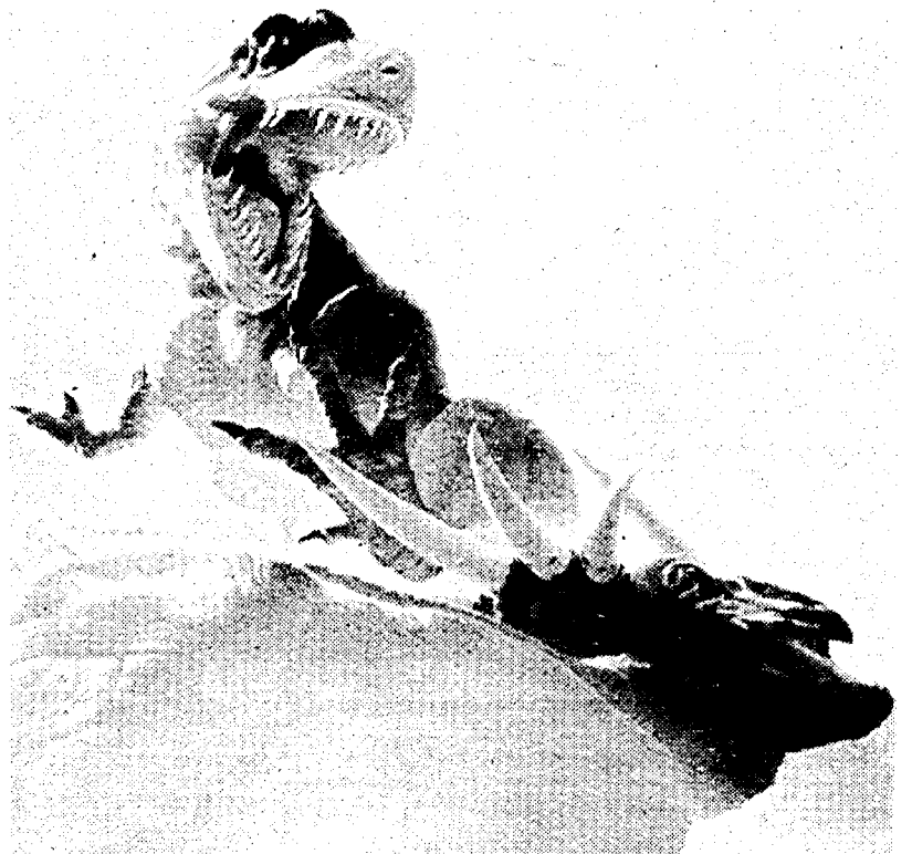
Un'immagine suggerita da «Jurassic park», libro in testa alle classifiche

fosse scordato i nomi dei parlamentari inquisiti, un «istant book» all'americana è arrivato recentemente in libreria per rimproverare la memoria agli italiani. I quali, evidentemente, hanno molto apprezzato l'iniziativa utile come promemoria per le discussioni tra vicini di ombrellone. I due volumetti (uno per i deputati e uno per i senatori), di anonimo sono editi da Sapere 2000 e costano il primo 12.000 lire e il secondo 6.000.