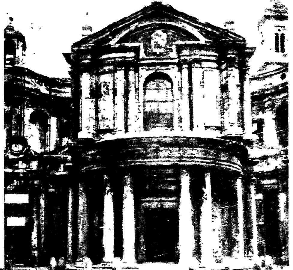
Facciata di Santa Maria della Pace realizzata da Pietro da Cortona, di lato spaccato della lanterna di Sant'Ivo alla Sapienza di Borromini