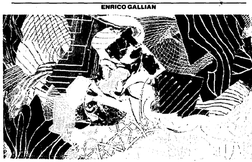
Particolare di un quadro di Frank Stella del 1993 in mostra al Palaeoxo