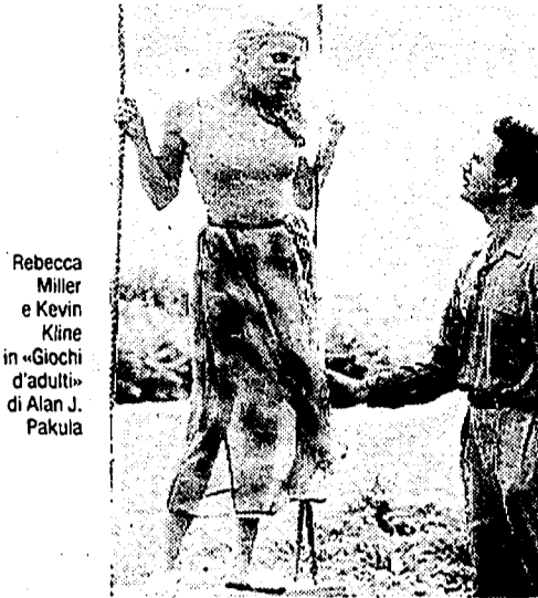
Rebecca Miller e Kevin Kline in «Giochi d'adulti» di Alan J. Pakula