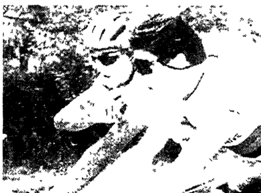
Gianni Bugno e Claudio Chiappucci, compagni rivali in azzurro

Per la prima volta in Norvegia e per la prima volta campionati del mondo di ciclismo open nel settore della pista di lottanti e professionisti insieme sul tonfornio in legno di Hamar dove dal 17 al 22 agosto verranno assegnati otto titoli maschili e tre femminili. Poi le cinque prove su strada in quel di Oslo: col mirino puntato sulla corsa dei «big» che avrà nella nazionale azzurra la sua squadra più agguerrita. In sostanza un lungo torneo per la conquista di sedici medaglie indelebili nella terra dei fiordi delle spiagge pulite dei grandi boschi e dei grandi ruscelli. Scarsa però l'attenzione di Hamar e della città di Oslo. La pista infatti è di livello medio e con poche iniziative in vista.