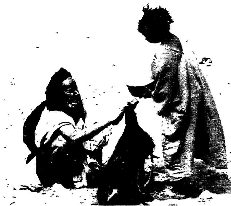
In alto, un ragazzo riempie d'acqua la borraccia di un anziano, accanto, un pozzo d'acqua nel deserto e sotto ragazze che fanno la fila alla fonte

In Senegal, nella zona orientale più povera, è nato un sodalizio spontaneo tra un bianco e un nero, un ingegnere romano e un capo bassari, per trovare l'acqua là dove si è abituati ad aspettarla dal cielo. Una piccola impresa, due pozzi a Ethiole e Salemata, che per quell'etnia dimenticata significa non soltanto vincere la sete ma la riconquista della propria terra e del diritto a restarci.