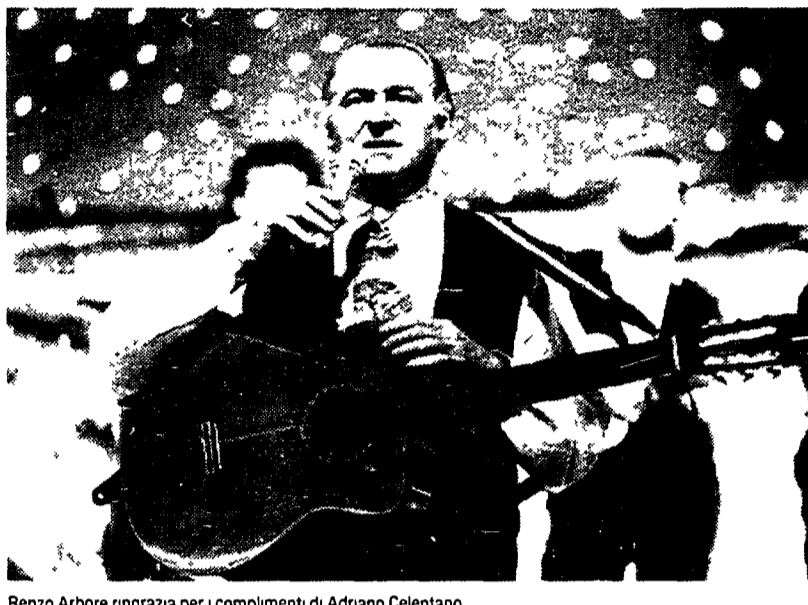
Renzo Arbore ringrazia per i complimenti di Adriano Celentano

Tutto ha inizio a Montecarlo Arbore e la sua Orchestra italiana suonano allo Sporting Club Tra il pubblico c'è anche Celentano Canta, si sbraccia, si complimenta Poi, non pago, prende carta e penna e scrive alla Stampa trenta righe di puro e spassionato elogio «Arbore il foggiano col suo concerto bomba ha acceso una miccia esplosiva in fondo alle origini napoletane dove frammenti di blues e di rock, con inflessioni talvolta reggaeggianti, sono venuti alla luce creando uno spostamento d'aria»