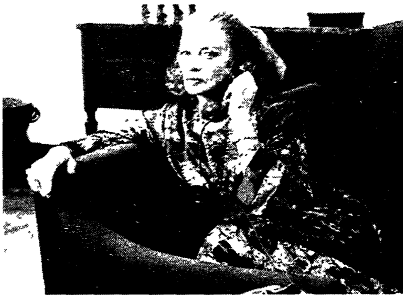
Capucine tra gli interpreti di «Sangue blu».

Al suo fianco è la madre una anziana nobildonna interpretata dalla scomparsa Capucine che anche questa volta non scappa al ruolo di elegantissima e affascinosa signora che ha reso celebre negli anni Sessanta a partire dalla sua interpretazione nel 64 al fianco di Peter Sellers ne La pantera rosa.