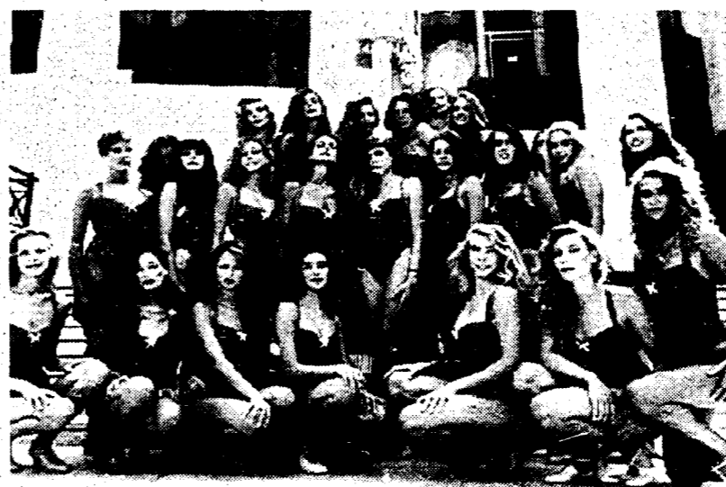
Le finaliste di «Bellissima '93»

Senza un giorno di tregua, da mercoledì a sabato prossimo tomla, poi, all'attacco Raiuno con quattro serate di Miss Italia: mercoledì e giovedì due anteprime in onda alle 22; venerdì e sabato spettacolo in prima serata (ore 20.40). Vi pare poco? Eppure i patron dei due concorsi sembrano non voler accorgersi dell'overdose di passerelle e soprattutto delle evidenti similitudini. «Noi