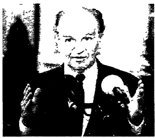
Il presidente bosniaco Alija Izetbegovic