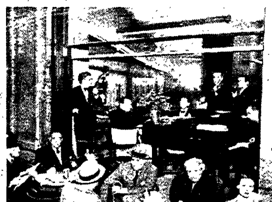
Anni 50: clienti e orchestrali del Caffè Berardo sotto la Galleria Colonna; in alto a sinistra un disegno di Marco Petrella

Il gruppo Forma è un insieme di artisti tutti giovani, ventenni o poco più, abbastanza compositi, in parte di artisti siciliani venuti sul continente dopo la Liberazione e in parte di artisti romani, il cui punto in comune è l'appartenenza alla stessa generazione, con la