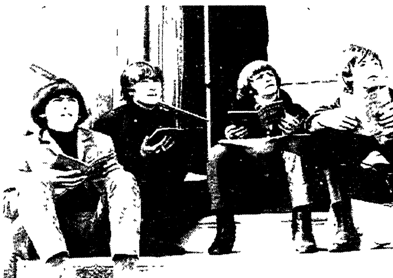
Un'immagine dei Beatles ai tempi del grande successo

Eravamo nello studio numero 2 di Abbey Road dove sono state realizzate le prove e molte delle registrazioni originali delle canzoni dei Beatles. Uno studio che è diventato una specie di luogo sacro per la musica pop. La presenza di un vero Beatles ha concretizzato una specie di epifania con un risultato insieme semplice e commovente. Ci è venuto voglia di dire: «Bye bye George sei tornato a camminare sul pavimento di legno a spina di pesce come trent'anni fa sul pavimento dove tu, John, Paul e Ringo battevatte i piedi per