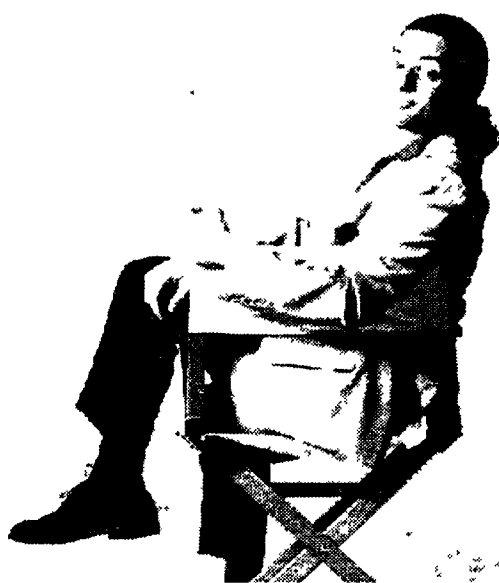
Fiorello Dal 20 settembre torna su Italia 1 il suo «Karaoke»

Metti una sera a cena con Fiorello il «re del karaoke» presenta la nuova edizione del programma di Italia 1 «rivelazione dell'anno» Respingendo le accuse di «pericolosità» lanciate da alcuni psicologi e lo sdegno degli intellettuali per la versione «dance» del San Martino di Carducci tutto in burla, naturalmente Col suo carisma popolare e la paterna benedizione del «patron» Claudio Cecchetto