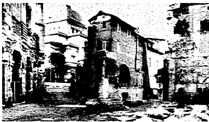
Due scorci suggestivi dell'ex Ghetto

Una mostra a cielo aperto, che si snoda su un tratto del marciapiede di via di Portico d'Ottavia, dove resterà fino al 3 ottobre. Questi gli elementi più visibili di «Restituta iuvant», l'esposizione dedicata al ripristino dell'ex Ghetto, allestita dall'Ufficio speciale interventi per il centro storico del Comune (Usics) e dalla ditta Dioguardi. Ma le foto storiche sulla vita quotidiana della comunità ebraica romana nell'800, le planimetrie che tratteggiano il recupero dell'area, le indicazioni su esperimenti di restauro, tutte dispiagate su agili strutture bianche, non sono che un iceberg, un segnale esteriore di un lavoro lungo e profondo, e, soprattutto, unico finora nella capitale. Insomma, la mostra in programma in