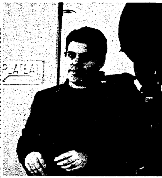
Il regista israeliano Amos Gitai