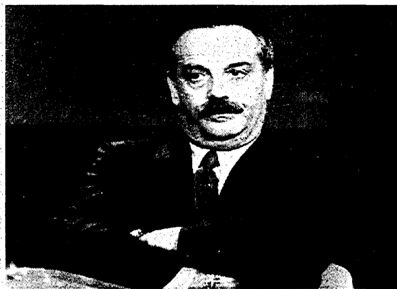
Giampaolo Sodano, direttore di Raidue ha presentato il nuovo palinsesto

ROMA. Aria di smobilitazione a Raidue. Facce lunghe, apparizioni fugaci di capistruttura subito pronti a scomparire, lo stato d'animo di chi ha già le valigie pronte. Così ieri si è presentato al Premio Italia lo staff di Giampaolo Sodano per annunciare il nuovo palinsesto. «La Rai per me è come una moglie - spiega il direttore della seconda rete, che ha rimesso il suo mandato al «governo dei cinque saggi» - Una donna con la quale vivo da trent'anni e dalla quale non vorrei divorziare. Ma se mi accorgo che questa non mi vuole più nel suo letto è chiaro che mi infilo in quello di un'altra. Certo è che il separato in casa non lo voglio fare». Sodano, insomma, in questo clima di incertezze e cambiamenti mostra di non perdersi d'animo. «Ho ricevuto proposte di lavoro - dice - da importanti emittenti straniere. Con Berlusconi, poi, mi ero già chiarito: finché si lavora in un'azienda non si possono fare altre cose. Ma nonostante tutto aspetto - e aggiungo - in queste settimane abbiamo lavorato normalmente, firmato contratti, coproduzioni. Abbiamo messo in piedi questo palinsesto proseguendo fedeli alla nostra linea che si basa su informazione e fiction».