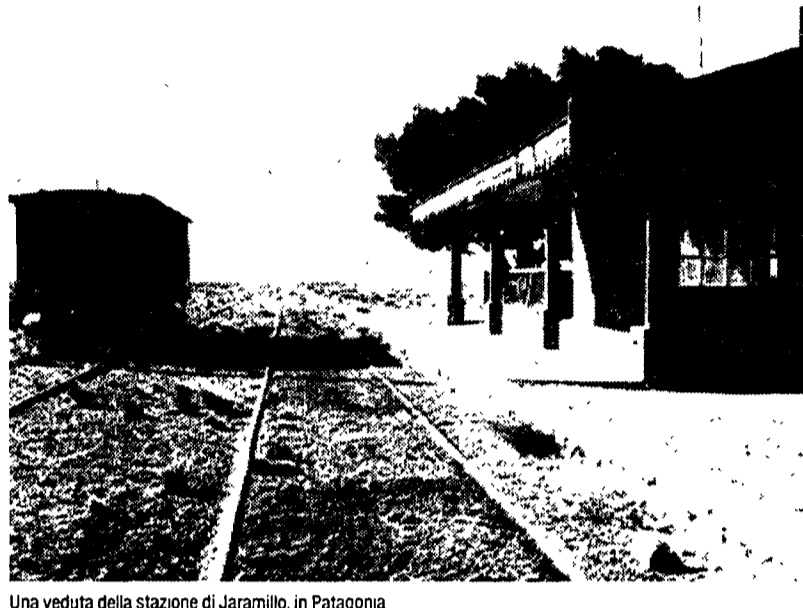
Una veduta della stazione di Jaramilla, in Patagonia