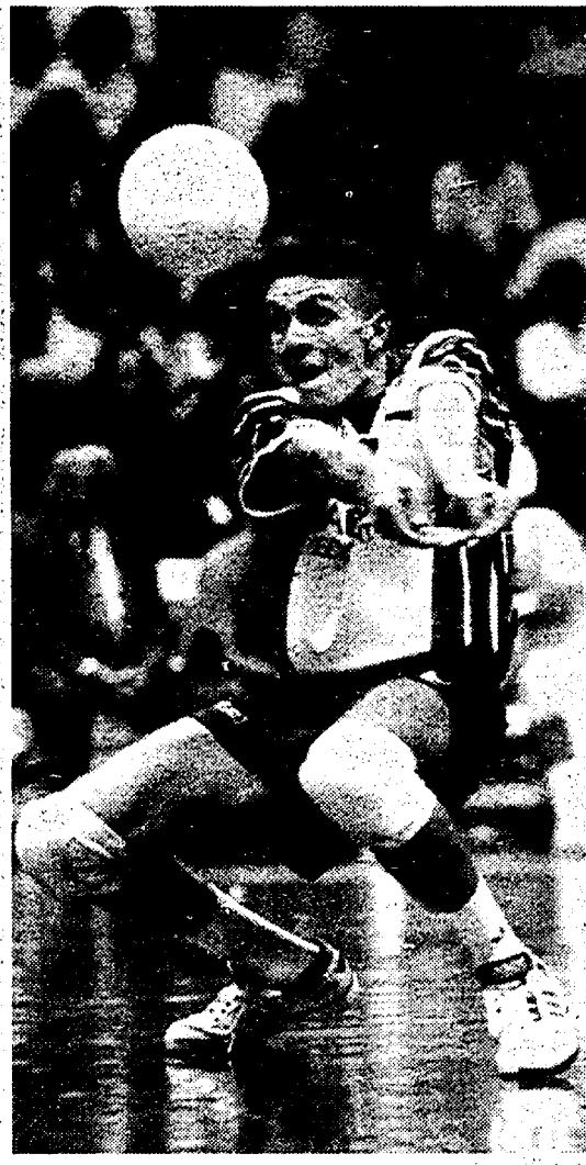
Due campionati al via: si ritorna nel Palasport

Il volley al nastro di partenza In quattro alla ricerca dello scudetto Restano le difficoltà di sempre: troppi i quattordici club per la serie A1