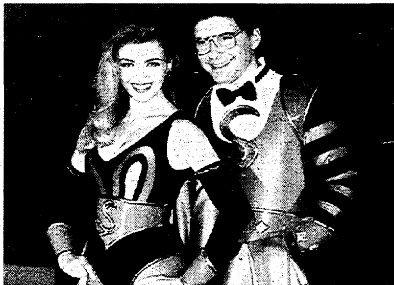
Fabrizio Frizzi e Milly Carlucci conducono «Scommettiamo che?»

Appesi ad un filo in abiti da Superman e Superwoman, Fabrizio Frizzi e Milly Carlucci voleranno su e giù per il teatro delle Vittorie a partire da sabato prossimo.