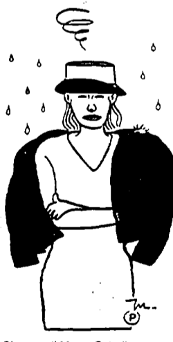
Disegno di Marco Petrella

Resistono gli artigiani di via dell'Orso e dintorni. La crisi del settore, la minimum tax , gli sfratti, l'assenza di una politica che valorizzi «quanto prodotto dalle mani e dalla creatività dell'uomo» non hanno compromesso l'allestimento della tradizionale mostra-mercato, giunta quest'anno alla diciannovesima edizione. Botteghe aperte dunque fino a tarda sera e, unitamente agli stand di espositori provenienti da tutto il Lazio e oltre, i vicoli compresi tra via della Scrofa, via di Monte Brianzo, via Zanardelli e corso Rinascimento ospiteranno musicisti, poeti, pittori, scultori, artisti di strada. E fino al diciassette ottobre nell'antico borgo, per l'occasione illuminato a candele, saranno spettacoli e concerti.