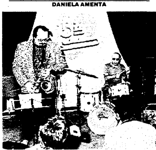
Il palchetto del Big Mama

Anche il Palladium (piazza Bartolomeo Romano, 8) vi riserva il «latin-sound» con l'appuntamento dei venerdì intitolato «Ben-Ben Noche». Ai quattro quarti ci pensa, invece, Radio Rock che ogni sabato - attraverso concerti dal vivo e discoteca ad hoc - riviverà il mito di trent'anni di musica. Fedele alla linea rimane il Big Mama (vicolo San Francesco a Ripa): «home of the blues»