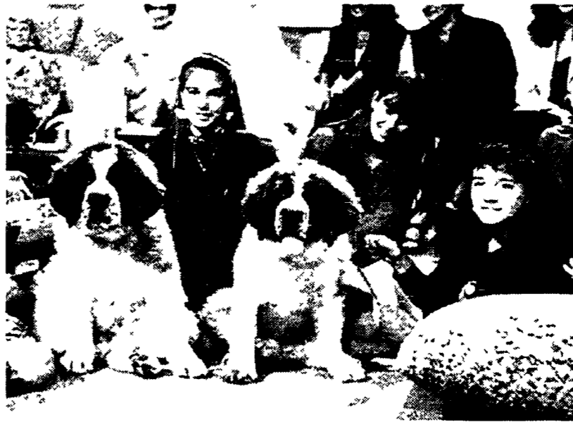
I due cuccioli di San Bernardo «can-duttori» di «Una caramella al giorno»

ROMA. Se negli anni passati si definiva «un programma per gli adulti da vedere con i bambini» quello al via oggi (su Raitre alle 12.55) è invece dedicato in modo particolare ai nonni. Proprio così, una specie di spazio di recreazione per nonni e nipotini. La quinta edizione di Caramella, una programmazione del Dse cambia target. E diventa Una caramella al giorno un appuntamento quotidiano. Ma, se d'ora in poi si rivolgerà a coloro che con i più piccoli condividono più tempo degli altri, i nonni il destinatario ultimo del programma di Franco Matteucci, Pier Alvise Zorzi e Patrizia Todaro rimane pur sempre il bambino. Quali giochi proporre alla piccola peste che scorrazza per casa? E come insegnargli a coltivare sane curiosità per il vanipinto mondo a prender gusto alla cultura all'arte ai viaggi? Una caramella al giorno dà ai nonni tanti suggerimenti e consigli. Considerando che fra l'altro il consiglio che ricor-