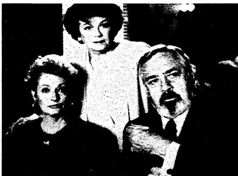
Diana Muldaur, Barbara Hale e Raymond Burr in «Scandali di carta» in onda stasera alle 20.40

È ovvio, allora, che per ricordare il celebre attore Raidue abbia scelto di mandare in onda una nuova serie del popolarissimo avvocato, che ha segnato l'immaginario collettivo di più di una generazione. Da stasera, dunque, alle 20.40, il mercoledì sarà dedicato (fino all'8 dicembre) ai casi di Perry Mason: una manciata di nuovi episodi che la rete aveva messo