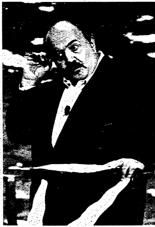
Maurizio Costanzo autore di «Vuoti a rendere»

Terza commedia delle dodici scritte da Costanzo, Vuoti a rendere è diretta da Gianni Fenzi e sarà dall'8 dicembre a Milano e poi in tournée. Nonostante l'amore apertamente dichiarato al teatro, «ultima forma di resistenza ai replicanti, ultima rappresentazione non elettronica», Costanzo non scrive testi dall'86. «Ho l'impressione che la realtà superi sempre la fantasia, che temi oggi attuali non regnano l'urto del tempo e del villaggio globale. Certo, è anche la conseguenza di una trasmissione come la mia, quotidiana e teatralissima, dove sera dopo sera invito mille signor Tal del Tali a interpretare loro stessi».