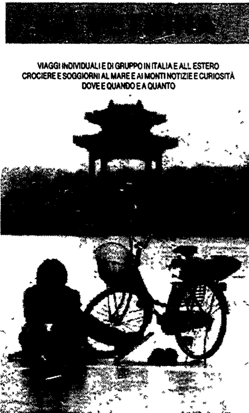
UNA SETTIMANA A PECHINO