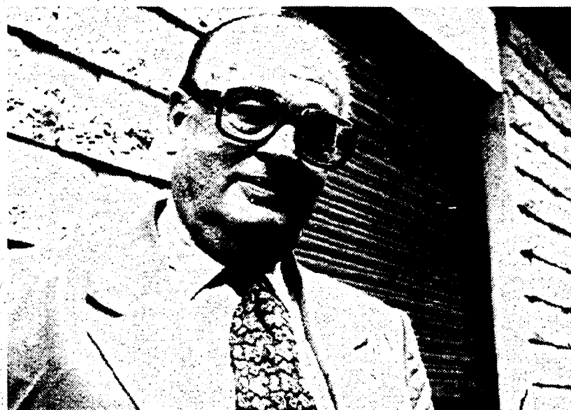
Qui accanto: il regista ha terminato di girare per la tv il film in quattro puntate «Famiglia Ricordi»

vano certo il gusto del pubblico. È andata in tutto il mondo, è piaciuta ovunque. In Italia è stata passata e poi dimenticata. Certo, era La Certosa di Parma , un po' noiosa... Poi ho fatto un film La vera storia della signora delle Camelie con Volontè, la Huppert, un grosso cast. Anche quello ha avuto un solo passaggio. Va bene, quello ha avuto la sua storia di film nelle sale... Poi ho fatto una cosa esclusivamente per la tv, Mosca, addio , con Liv Ullmann. Ha vinto vari premi, ma è rimasto chiuso per quattro o cinque anni in un cassetto. È una cosa che capita a molti registi. Ma a lei che giustifica l'abbandono della Rai? Ché finché un filmato non viene