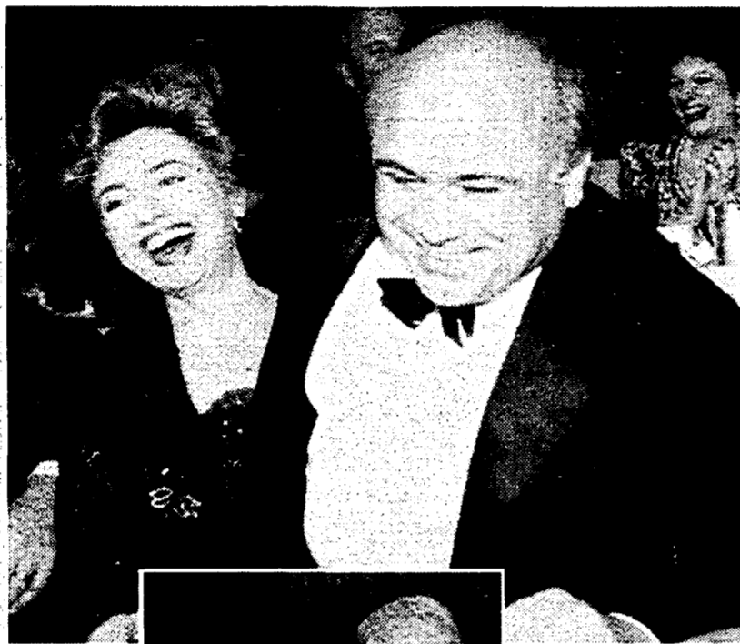
Gina Lollobrigida e Bill Clinton. Sopra: Danny De Vito e Hillary Clinton. Accanto: il modello Fabio Lanzoni e Geraldine Ferraro.