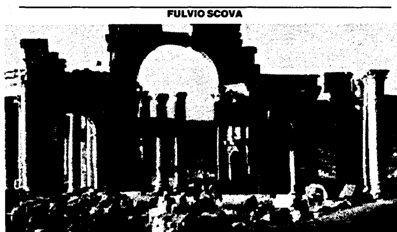
Palmira. Sullo sfondo il deserto siriano.

lERIA del souk, appare la grande Moschea: è da uno dei tre minareti (quello di sud-est) che, secondo la tradizione musulmana, scenderà Gesù Cristo, poco prima del Giudizio Universale. E poi ancora vicoli, piccole piazze e botteghe, prima di