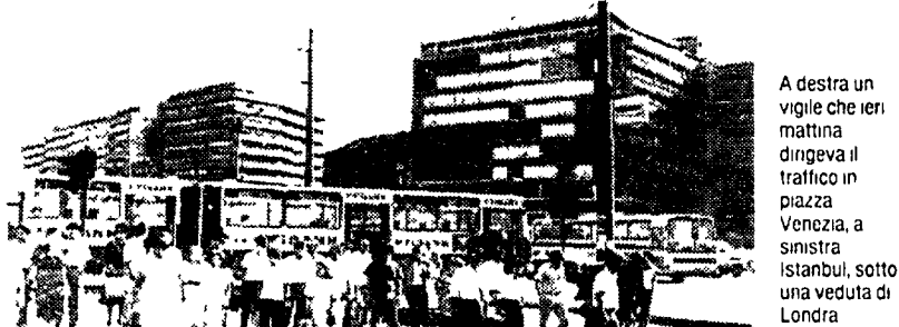
A destra un'immagine che ieri mattina tingeva il traffico in piazza Venezia, a sinistra Istanbul, sotto una veduta di Londra

Anche oggi a piedi dalle 15 alle 19 Il blocco delle auto di ieri non ha spazzato via l'inquinamento Ma Caruso non crede alle centraline