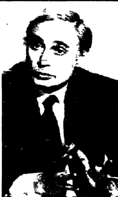
Il ministro della Difesa Graciov. In alto, l'incontro tra Eltsin e il presidente di turno Csce, il finlandese Suominen.

MOSCA. Sono determinati. Sino a trascinare Boris Eltsin in tribunale. E non si lasceranno facilmente scippare dal Cremlino le due più famose icone onore e vanto dell'arte russa.