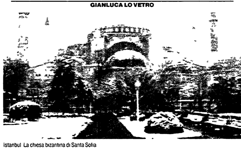
Istanbul. La chiesa bizantina di Santa Sofia

Lontano dai circuiti turistici: al cuore della cultura turca. In viaggio con l'Unità Vacanze da Istanbul sino in Cappadocia, via Ankara. A ritroso nei secoli, attraverso i reperti bizantini, greci e romani. I misteri delle città sotterranee. E la magnificenza della Moschea di Solimano.