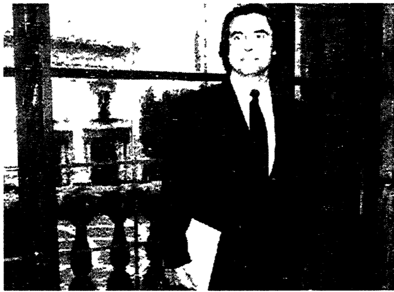
Riccardo Muti. Aprirà il programma della Scala dirigendo «La Vestale» di Gaspare Spontini