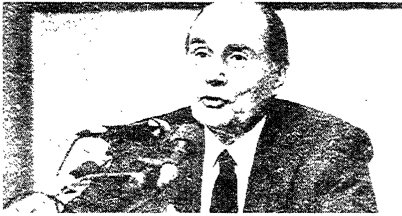
Il presidente francese François Mitterrand

Finalmente qualche segnale positivo per l'intrecciato dossier del Gatt. Il ministro dell'Industria francese, dopo un incontro con il negoziatore della Commissione europea Leon Brittan (che a sua volta aveva visto il presidente americano Clinton) ha valutato positivamente gli spiragli di disponibilità che vengono da Washington. La fase finale della trattativa si dovrà concludere prima del 15 dicembre.