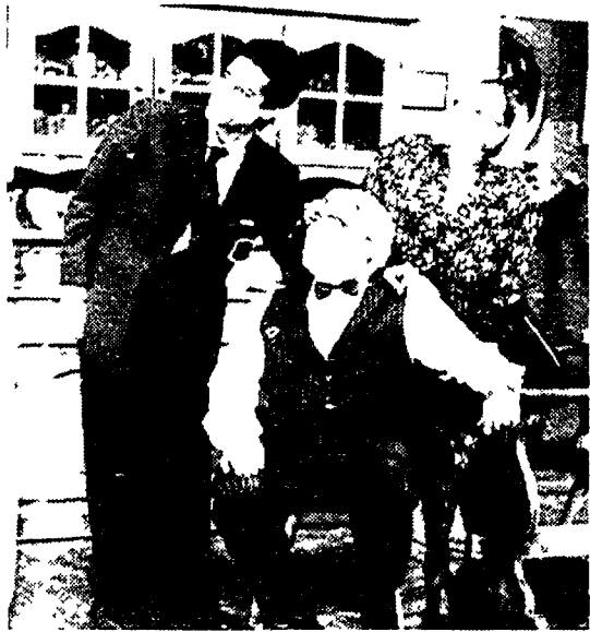
«Se un bel giorno all'improvviso» in scena al teatro Manzoni di Milano

Debutto di successo al teatro Manzoni di Milano, per «Se un bel giorno all'improvviso», scritta da Enrico Vaime e laia Fiastri e portata in scena da Gino Bramieri e Gianfranco Jannuzzi. La grottesca avventura di un tranquillo perito agrario, in casa del quale la irruzione, improvvisamente un miliardo il piacere dell'onesta contro il desiderio di ricchezza. Tutto però sotto l'occhio vigile della televisione.