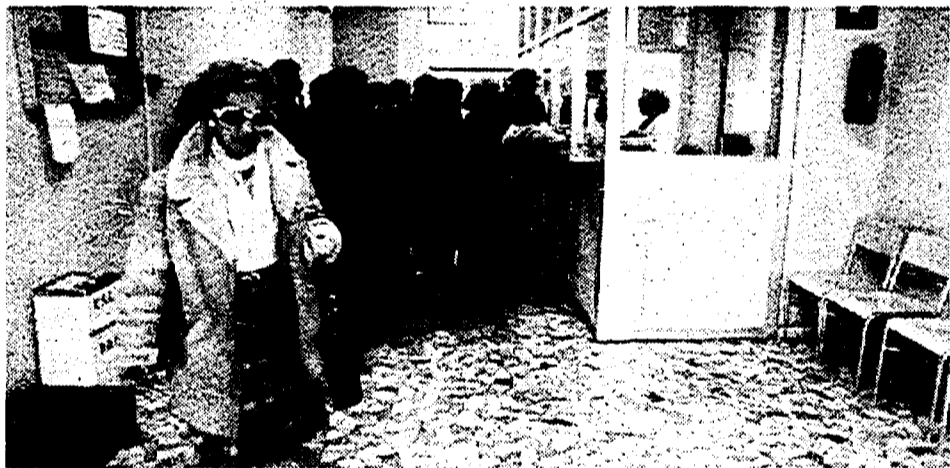
L'interno di una Usl