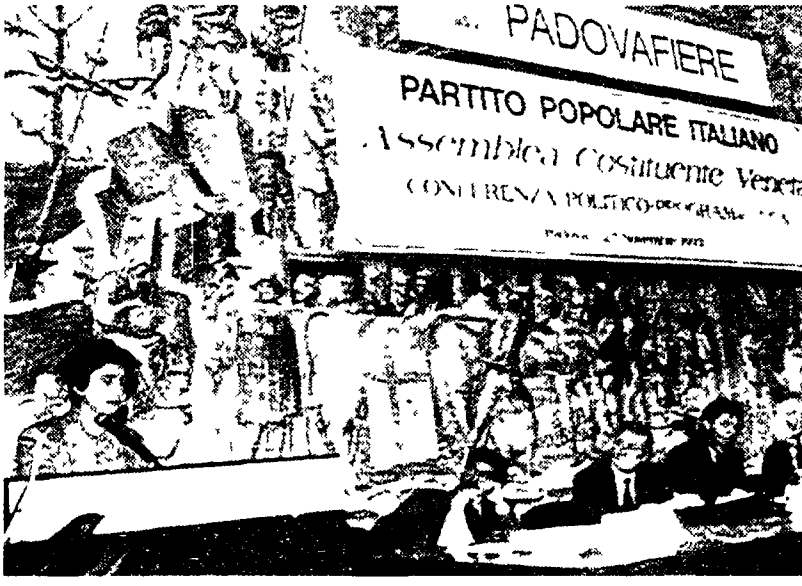
Rosy Bindi ha fondato nel Veneto il Partito popolare

simile ma il 14 giugno in rivoli di padri e di madre non dico del