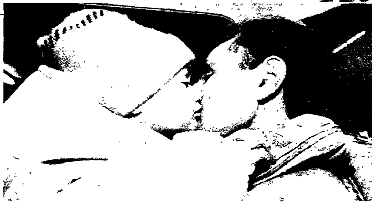
Un bimbo di cinque anni saluta il padre prima di lasciare Sarajevo. Sopra, soldati Onu nella capitale bosniaca