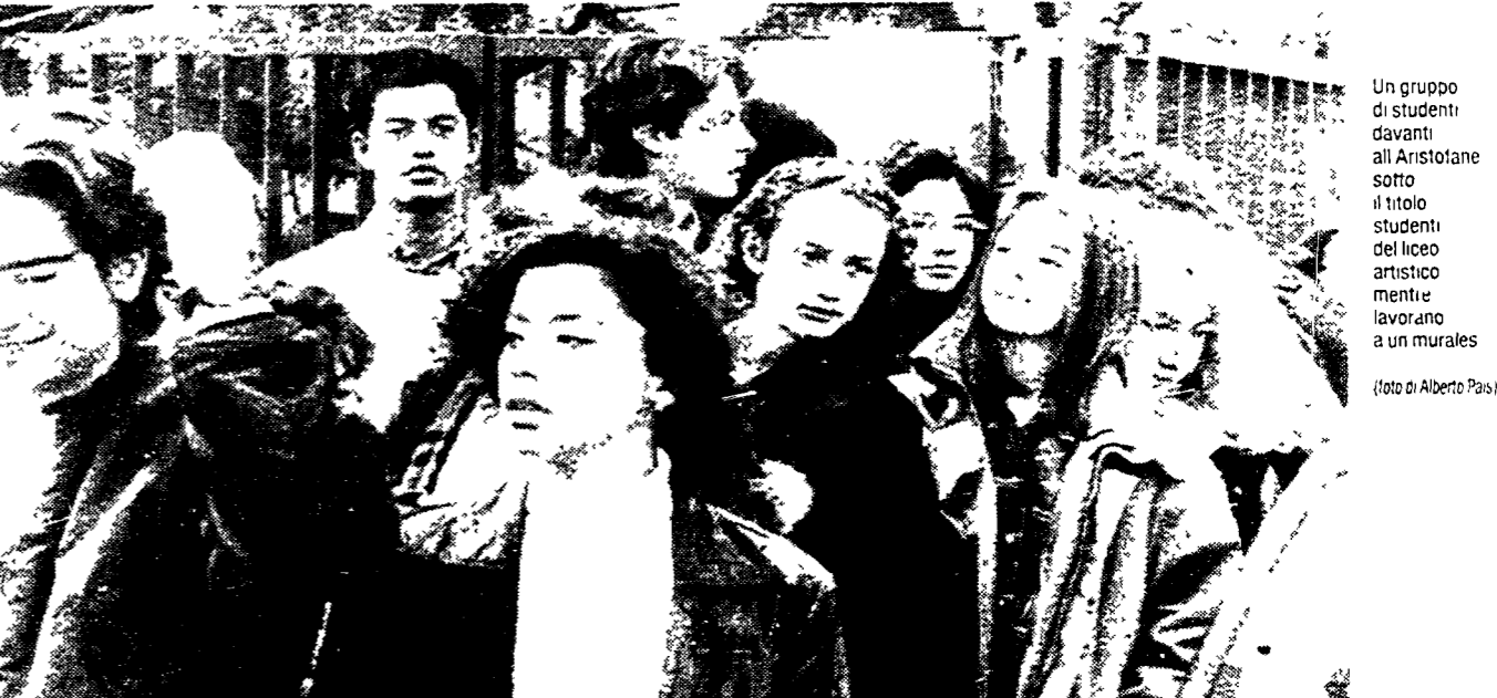
Un gruppo di studenti davanti all'Aristofane sotto il titolo studenti del liceo artistico mentre lavorano a un murales

Al «Tasso» un comitato alunni-docenti per l'elaborazione di un progetto alternativo... L'elenco delle autogestioni si allunga: altri 5 istituti tra la capitale e la provincia