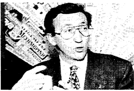
IL NUOVO CONSIGLIO