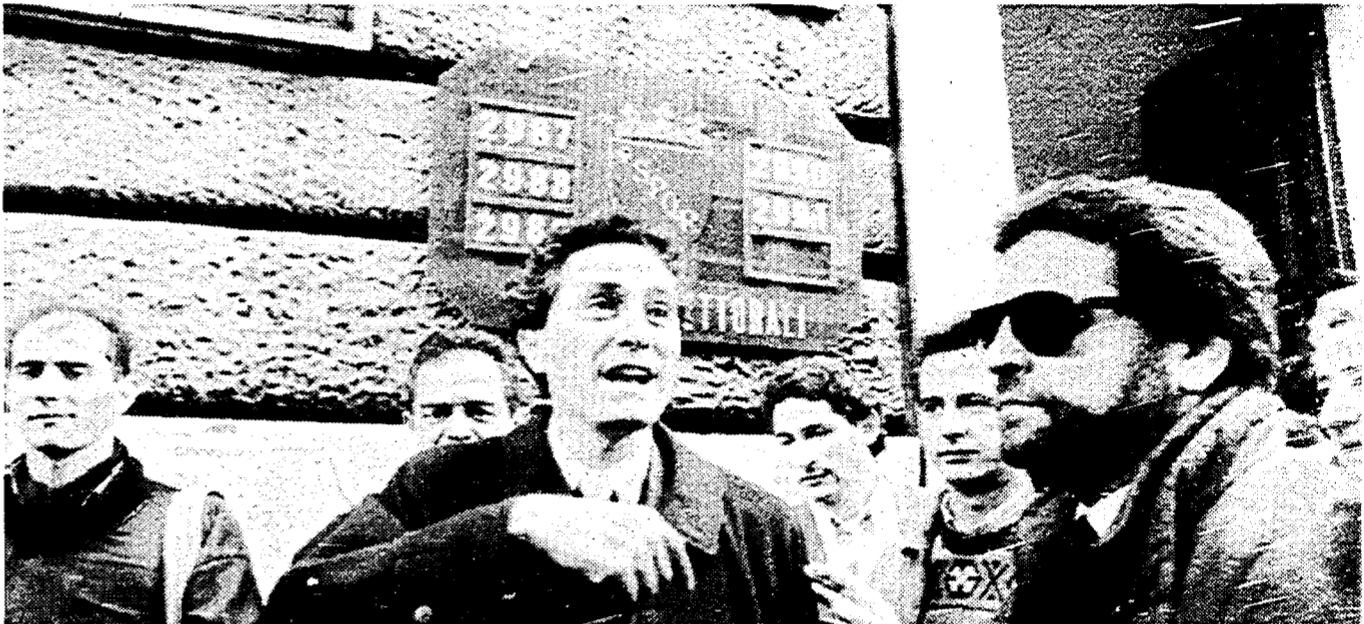
Rutelli telefona a Fini: garantiamo un clima civile