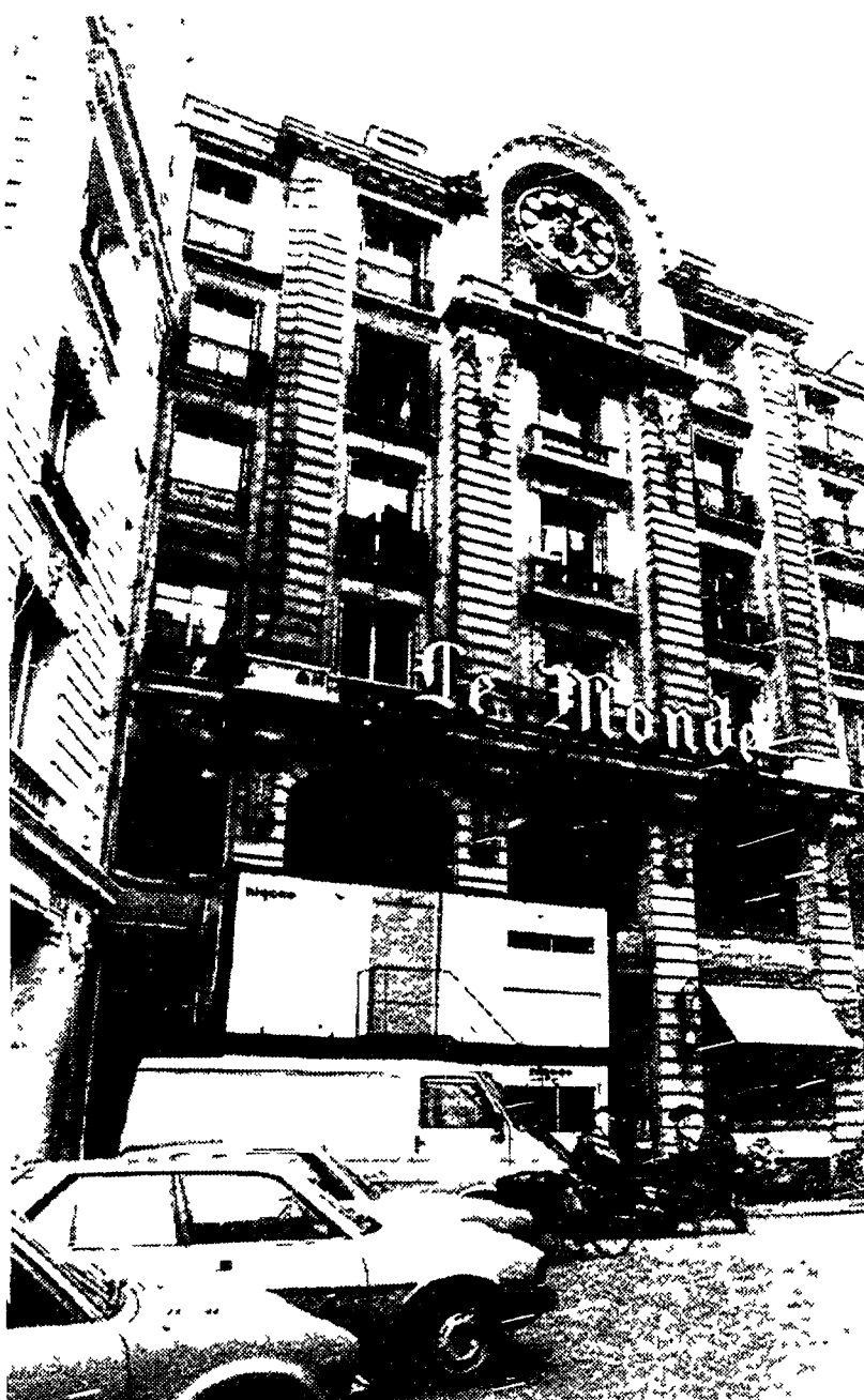
Una delle più belle viste di Roma. Trinità de Monti. A destra la sede parigina di «Le Monde»