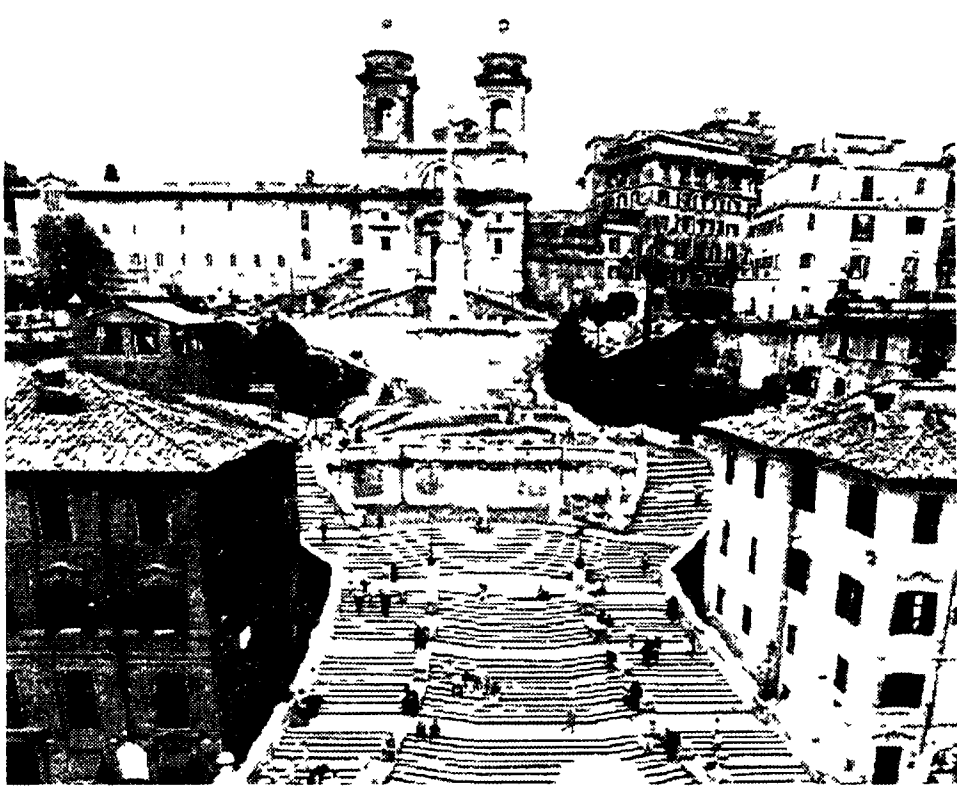
Una delle più belle viste di Roma. Trinità de Monti. A destra la sede parigina di «Le Monde»