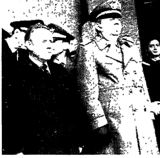
Il presidente del Consiglio Carlo Azeglio Ciampi. In alto il capo dello Stato Oscar Luigi Scalfaro

ROMA Nega di essere saltata sul carro del vincitore...»