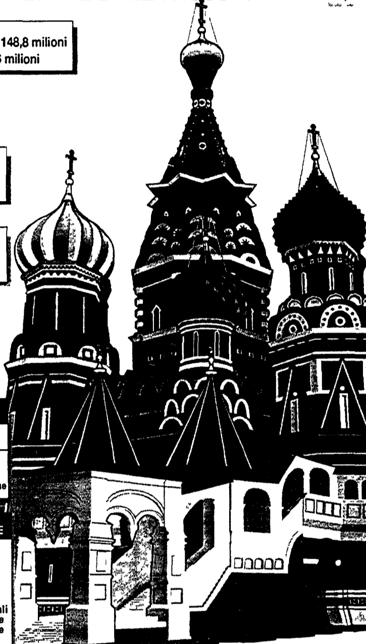
L'Unità - P&G Infograf

SISTEMA PROPORZIONALE Circoscrizione unica federale 225 seggi 1756 candidati riuniti in 13 blocchi elettorali (per entrare alla Duma è necessario superare la soglia del 5%)