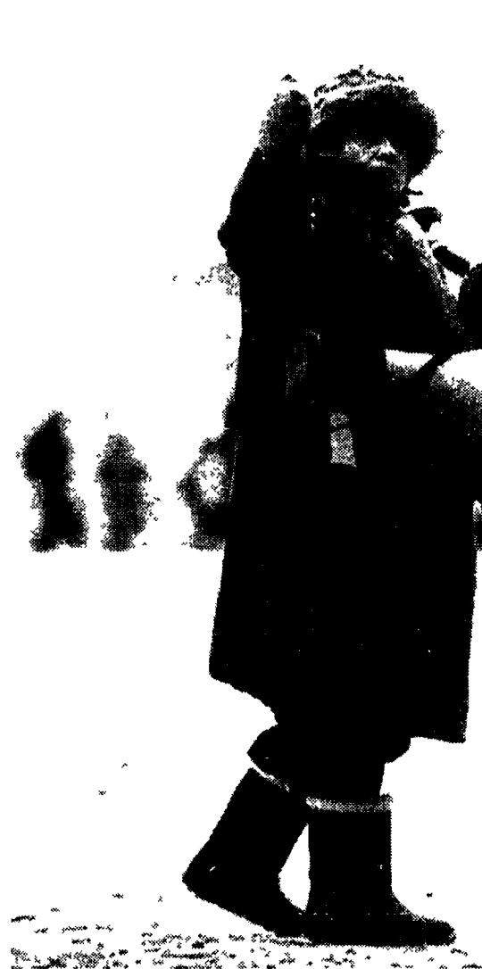
Un'immagine del presidente russo Boris Eltsin, sopra un attivista sulla Piazza Rossa.

MOSCA. È finita con un «giallo» la campagna elettorale russa. Un «giallo» attorno allo scenario istituzionale del paese se il progetto di Costituzione fortemente voluto da Eltsin non venisse approvato.