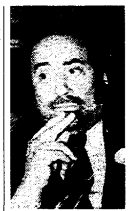
Ottaviano Del Turco

Su quest'ultimo versante, Carlo Azeglio Ciampi ha specificato che «le procedure della cassa integrazione straordinaria per le crisi aziendali saranno semplificate e rese più celeri e trasparenti».