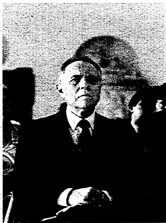
Carlo Azeglio Ciampi

Per spiegare queste posizioni, il presidente del Consiglio ha scelto l'impegnativa platea dei cooperatori, riuniti a convegno all'indomani della firma di una convenzione fra le tre centrali e il governo per lo sviluppo e l'occupazione.