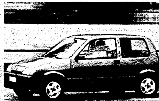
La Cinquecento adotta una «linea giovane», caratterizzata da quattro nuovi colori di carrozzeria in cui spicca il verde Flago

A due anni dalla commercializzazione la Fiat Cinquecento rinnova «la pelle» per andare incontro ai nuovi gusti dell'utenza e in particolare di quella giovanile. Ai giovani sono infatti dedicate espressamente le nuove colorazioni della carrozzeria: rosso Sporting, blu Line, giallo Primula e verde Flago metallizzato, abbinata a nuovi tessuti quadrettati per i rivestimenti interni.