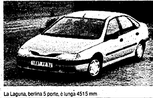
La Laguna, berlina 5 porte, è lunga 4515 mm

se antintrusione nelle portiere, dall'airbag al volante addottato di serie su tutte le versioni nei tre livelli di equipaggiamento (RN, RT, RXE) così come le cinture con pretensionatore a controllo elettronico, dai sedili antiaffondamento, dal servosterzo, da sospensioni che presentano all'avantreno uno schema McPherson con braccio inferiore a L e al retrotreno bracci tirati a geometria programmata (effetto auto-sterzante).