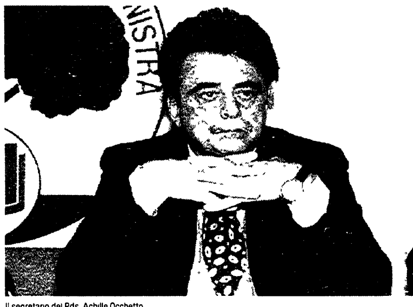
Il segretario del Pds, Achille Occhetto

ROMA «Segni trucca le carte. Andando in giro a dire che l'alleanza progressista non sarebbe che il "vecchio Pci" vuole impostare la campagna elettorale all'insegna delo scontro ideologico».